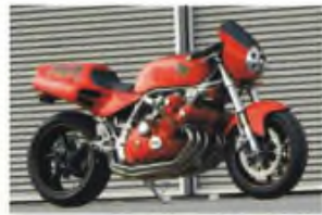
HONDA NS 6 CILINDRI