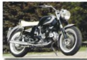
DUCATI APOLLO TOTTI