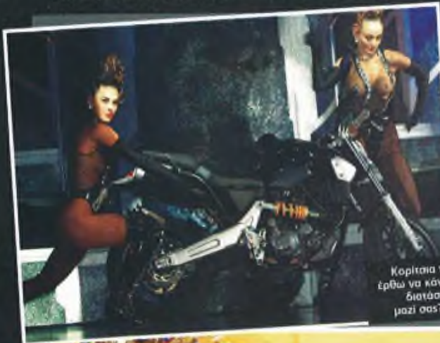
Κορίτσια να έρθω να κάνω διατάσεις μαζί σας???

νό άλλο πλανήτη και συγκεκριμένα από τον πλανήτη MotoGP. Τα υλικά που χρησιμοποιήθηκαν για την κατασκευή της μοτοσυκλέτας είναι το ένα πιο εξωτικό από το άλλο. Carbon, μαγνήσιο και τιτάνιο συναγωνίζονται για το ποιο θα κερδίσει τη μάχη των εντυπώσεων... Let the fight begin. Αυτό το γλυπτό σε δυο τροχούς θα είναι διαθέσιμο της αρχές του 2007 και θα κοστίζει περίπου €30.000.