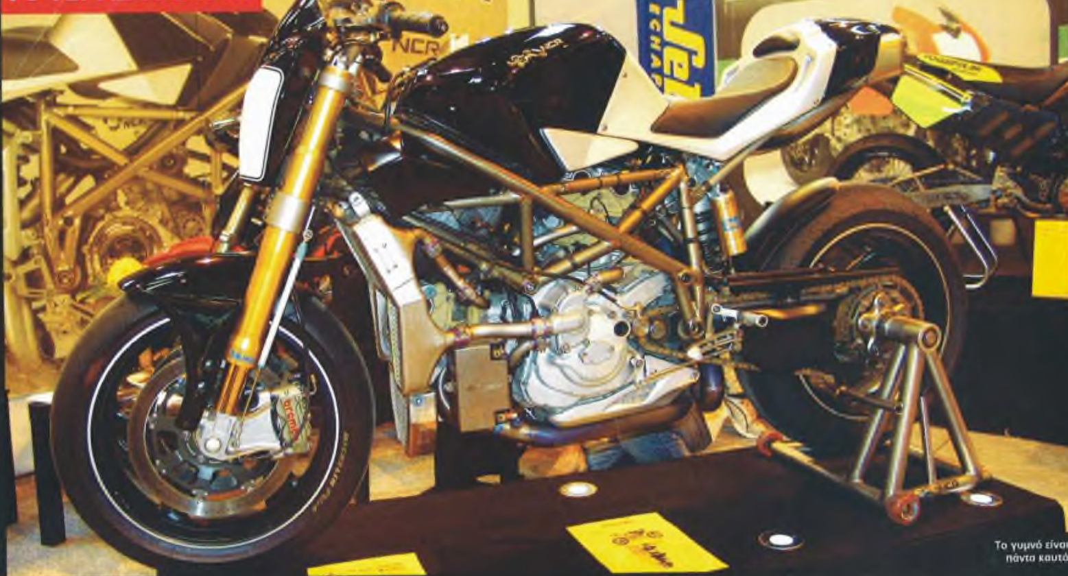
Το γυμνό είναι πάντα καυτό

Ε πιτέλους η NCR, διάσημη για τις εξωτικές μοτοσυκλέτες με κινητήρες Ducati, είναι έτοιμη να βγάλει στην παραγωγή το Macchia Nera. Πρόκειται για μια γυμνή μοτοσυκλέτα σχεδιασμένη από το μάγο Aldo Drudi με βελτιωμένο κινητήρα 998 από το αγωνιστικό τμήμα της Ducati! Η αναλογία κιλών ανά ίππο είναι παρωσιακή μιας και το θηρίο ζυγίζει μόλις 135 κιλά ενώ βγάζει 185 κα-