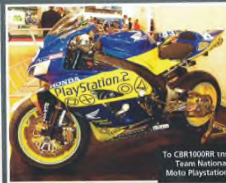
Το CBR1000RR της Team National Moto Playstation