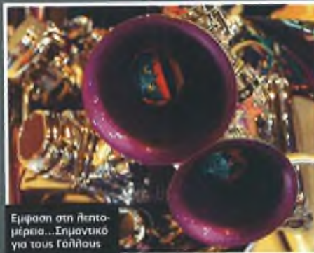
Εμφάνιση στη λεπτομέρεια...Σημαντικό για τους Γάλλους