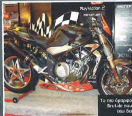
Το πιο όμορφο Brutale που έχω δει