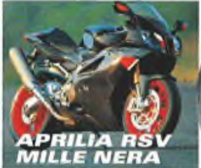
APRILIA RSV MILLE NERA