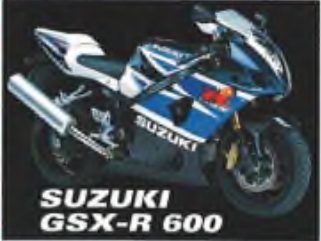
SUZUKI GSX-R 600