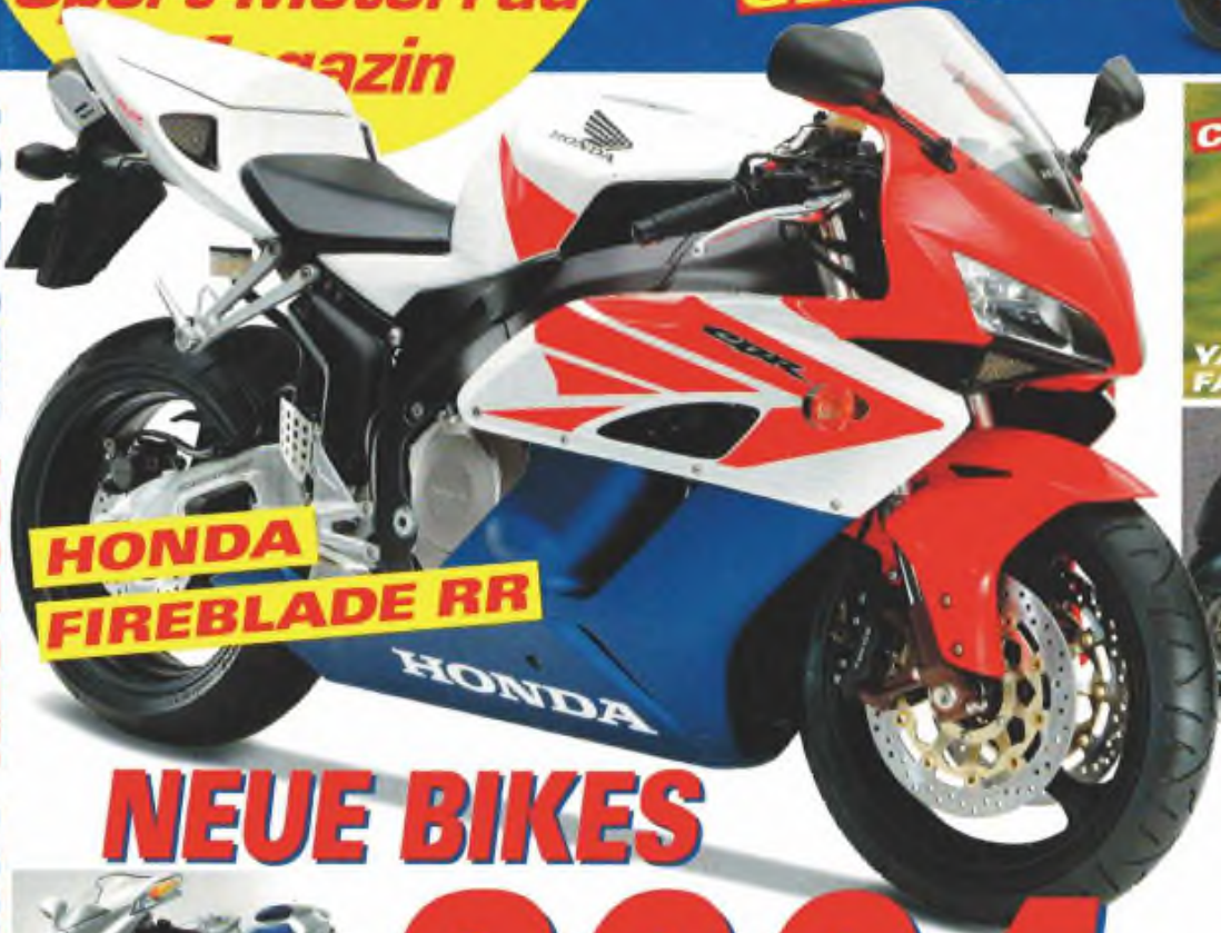
HONDA FIREBLADE RR