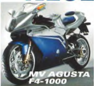
MV AGUSTA F4-1000