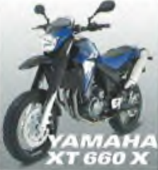
YAMAHA XT 660 X