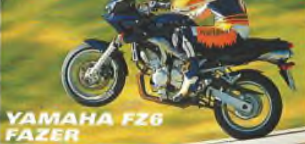
YAMAHA FZ6 FAZER