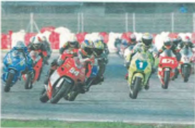
Una partenza di questa stagione della classe 250 Sp