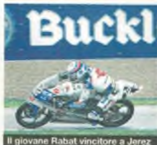
Il giovane Rabat vincitore a Jerez